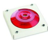
МАЯК-220-КПМ1-НИ оповещатель комбинированный, металлический корпус, наружное исполнение